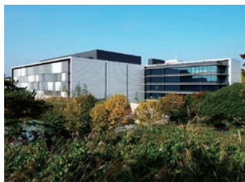
東京第一データセンター

NRIの東京第一データセンター（T1DC） (注) は、一般 社団法人グリーンIT推進協議会の「グリーンITアワード 2013」におい て経済産業大臣 賞を、また、公 益財団法人日本 デザイン振興会 の「2013年度 グッドデザイン 賞」を受賞した。